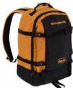
Cod: 150 MOSTAZA