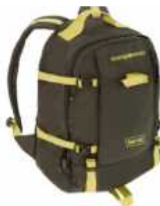
Cod: 140 FOREST