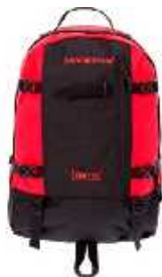
Cod: 110 RED