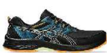
Cod: 009 ASICS GEL SONOMA 7 (Mod: 1011B050) *** Premios sujetos a modificaciones según disponibilidad de tallas y colores.