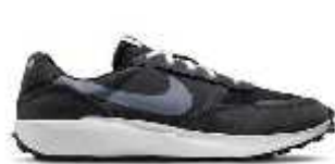
Cod: 001 FactoryMora: 64 Adultos 128 Niños 192