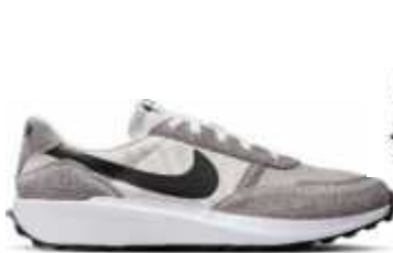
Cod: 003 (Mod: DH6193)