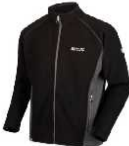
Cod: 92B BLACK