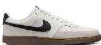
Cod: 133 (Mod: FD2722)