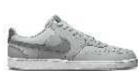
Cod: 077 NIKE PEGASUS 41 (Mod: FD2722) *** Premios sujetos a modificaciones según disponibilidad de tallas y colores.