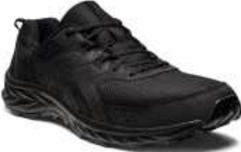
Cod: 001 FactoryMora: 80 Adultos 160 Niños 240