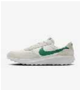
Cod: 101 NIKE COURT VISION LOW (Mod: DH6193) *** Premios sujetos a modificaciones según disponibilidad de tallas y colores.