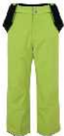
Cod: 1FR NEON GREEN