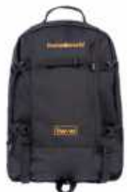
Cod: 110 BLACK