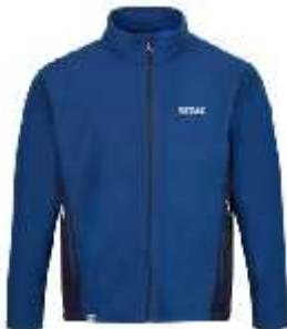
Cod: 91Q MARINO